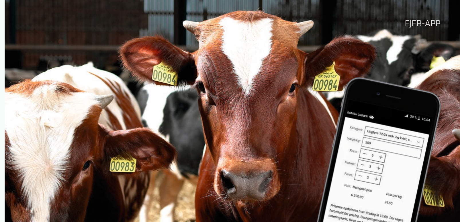
Her kan du se, hvordan Prisberegneren ser ud i appen. Når du har indtastet oplysninger om dyret, trykker du på den grønne lommeregner. Herefter giver appen et overslag på prisen for dyret.

Du kan hente fakta-arkene på udviklingscenter.com. ■