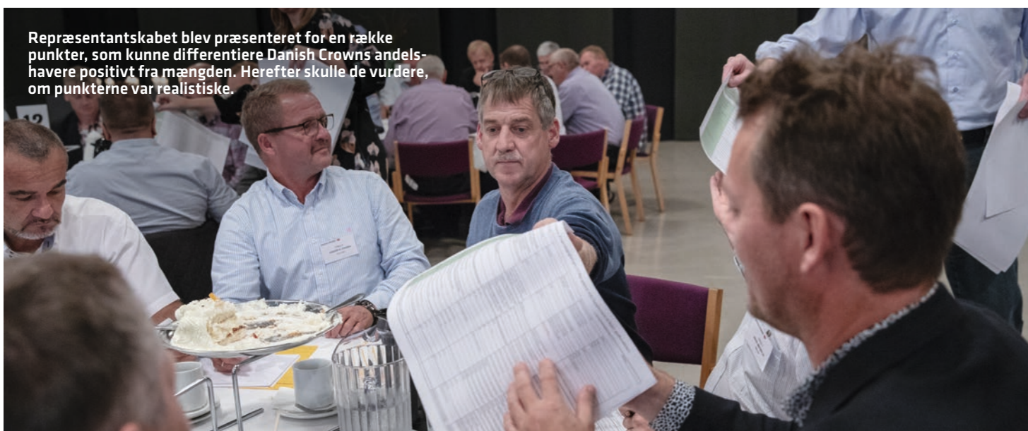
Repræsentantskabet blev præsenteret for en række punkter, som kunne differentiere Danish Crowns andelshavere positivt fra mængden. Herefter skulle de vurdere, om punkterne var realistiske.