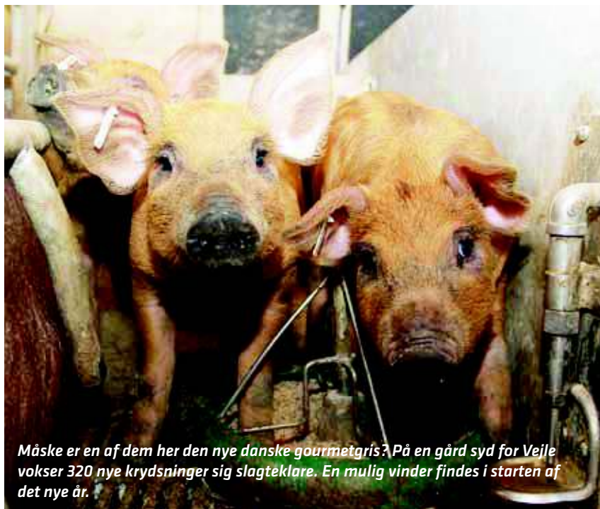
Måske er en af dem her den nye danske gourmetgris? På en gård syd for Vejle vokser 320 nye krydsninger sig slagteklare. En mulig vinder findes i starten af det nye år.

Søerne til projektet er alle danske – halvdelen er L/Y, mens den anden halvdel er Duroc. Ornerne er dels iberiske